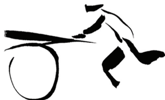
マルケ 《手押し車》1904年